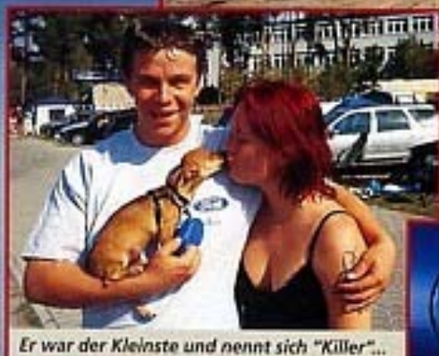
Er war der Kleinste und nennt sich "Killer"...

Neben einem 29er Model T war der Edsel der einzige Ami auf dem Gelände