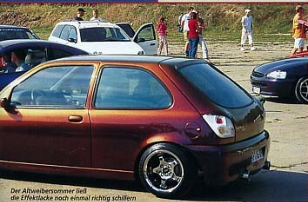
Der Altweibersommer ließ die Effektlacke noch einmal richtig schillern