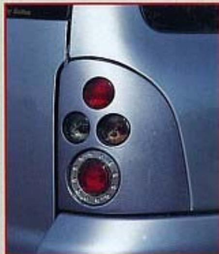
Eigenbau am Mondeo Turnier