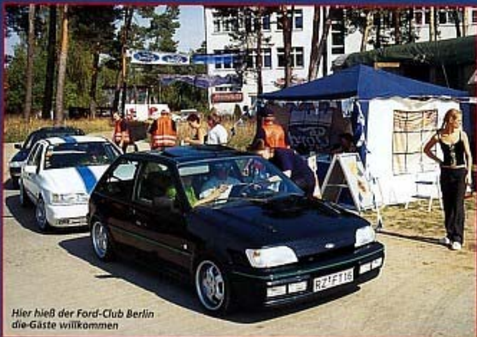
Hier hieß der Ford-Club Berlin die-Gäste willkommen