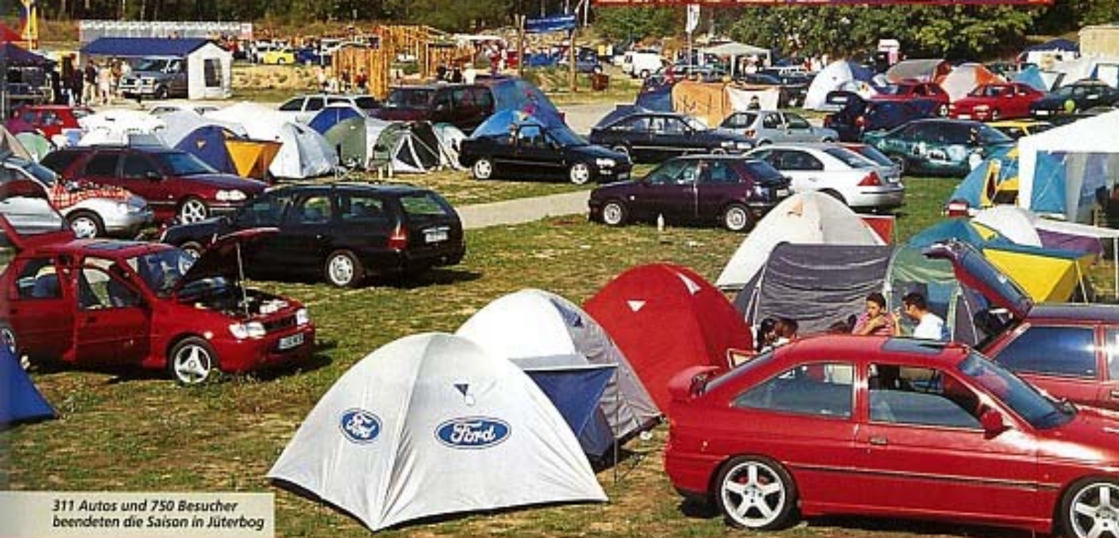
311 Autos und 750 Besucher beendeten die Saison in Jüterbog

Der Altweibersommer machte seinem Namen alle Ehre: Herrlicher Sonnenschein am ganzen Wochenende lockte 311 Fahrzeuge und über 750 Besucher auf das Gelände der Kartbahn Niedergöhrsdorf bei Jüterbog. Die Fahrzeugjury - wieder vertreten durch die Crazy Car Connection - hatte dank verschiedenster Kategorien ein volles Programm zu absolvieren. Eine gute Idee, alle "Pokalabräumer" digital zu fotografieren und bei der Siegerehrung auf einer Großleinwand