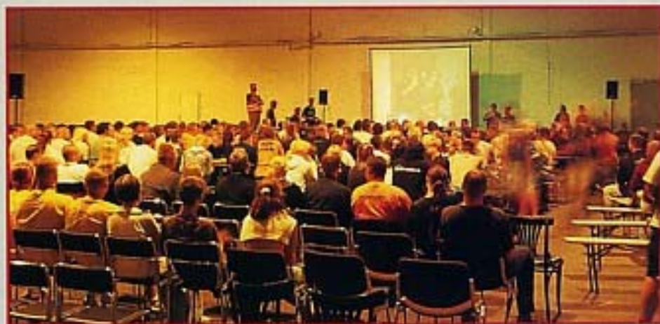
Pssst, die Ford-Szene tagt...