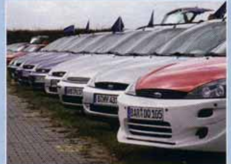
Der Ford Focus Club Deutschland

Erbsen weiterreichen, einen Nagel auf genau 58 Millimeter versenken, originale Fordschrauben ihrer Funktion im Fahrzeug zuordnen – und nicht zuletzt der Tischtennisball, der von einem anderen Clubkameraden durch beide Hosenbeine gebracht werden musste. Der Ford Club Magdeburg sicherte sich Platz 1. Parallel startete das Beschleunigungsrennen – hier verlief alles unproblematisch, nie-