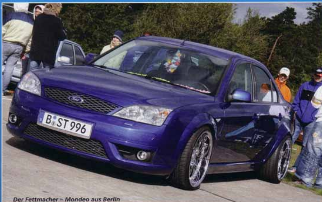
Der Fettmacher – Mondeo aus Berlin