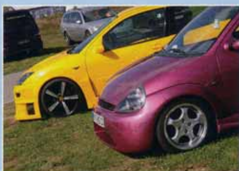
Die Spoiler-Jungs – Ka und Focus im neuen Gewand