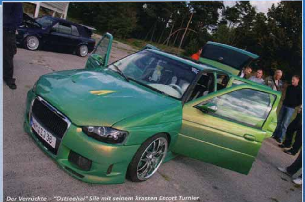
Der Verrückte – "Ostseehal" Sile mit seinem krassen Escort Turnier