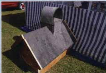
Die Heizer – war 2007 vonnöten: Gasbrenner mit Häusl