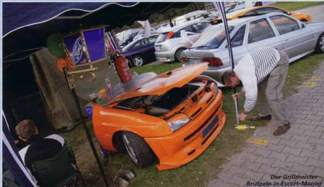
Der Grillmeister – Brutzeln in Escort-Manier