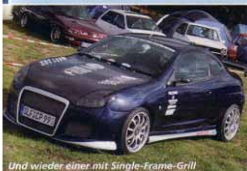
Und wieder einer mit Single-Frame-Grill

Es war wieder einmal soweit! Wie schon in den Jahren zuvor, freute sich die Ford-Szene auch 2007 auf das Event in Jüterbog, etwas südlich von Berlin im schönen Fläming gelegen. Wo andere Autotreffen schon längst die Zelte abgebrochen hatten, veranstaltete der Ford Club Berlin e.V. sein bekanntes und beliebtes "Abzelten".