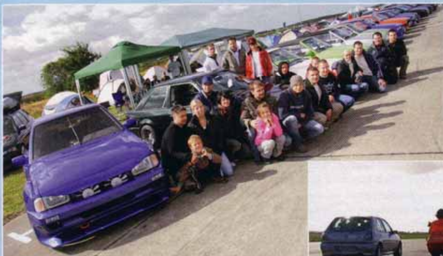
Ohne Clubnamen, aber fest befreundet!