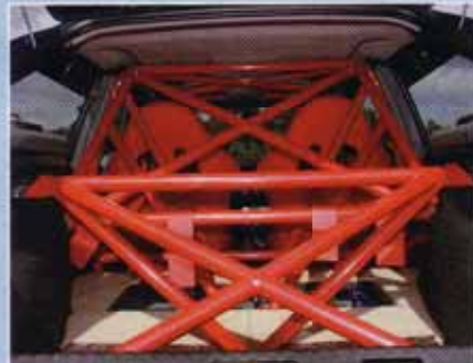
Der Stahlbauer – 37 Meter Eisen im Escort