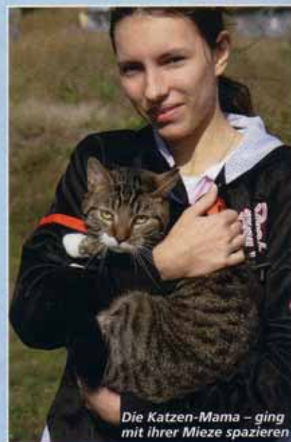
Die Katzen-Mama – ging mit ihrer Miese spazieren