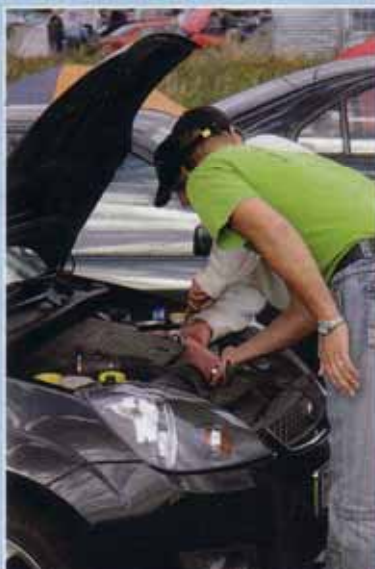
Nix ADAC – selbst ist der Mann!

zur Clubbegrüßung ein. Später setzten sich die Veranstalter hin und rechneten spaßeshalber die Gesamt-Kilometerleistung aller Teilnehmer zusammen. Alleine deren Anfahrtsstrecken summierten sich auf stolze 139.780 Kilometer. Besonders die Clubspiele fanden wieder großen Anklang, 14 Teams nahmen die Herausforderung lustiger Spielchen an. Beispiele gefällig? Mit einem Strohhalm