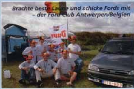
Brachte beste Laune und schicke Fords mit – der Ford Club Antwerpen/Belgien