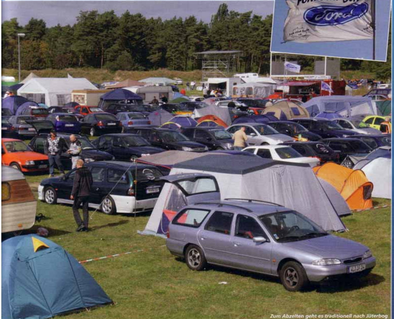
Zum Abzelten geht es traditionell nach Jüterbog